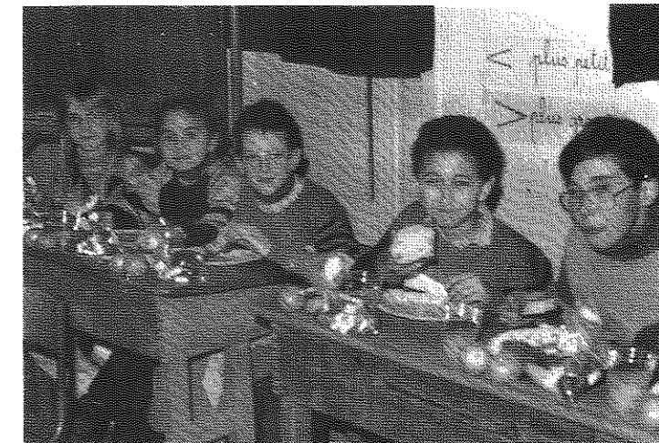
Goûter des enfants