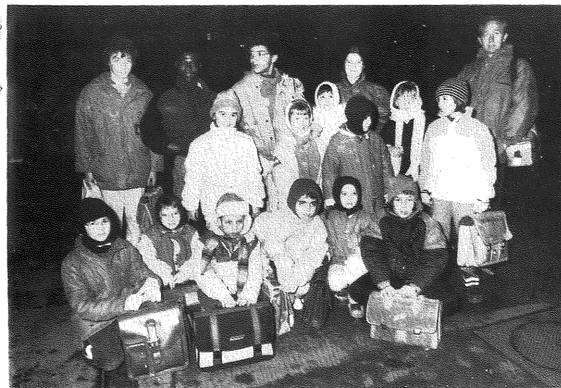
Classe de neige