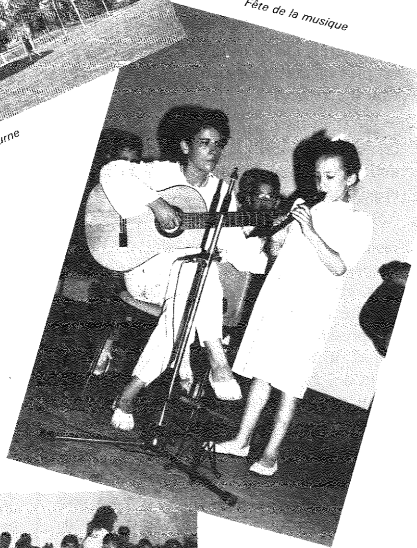
Fête de la musique