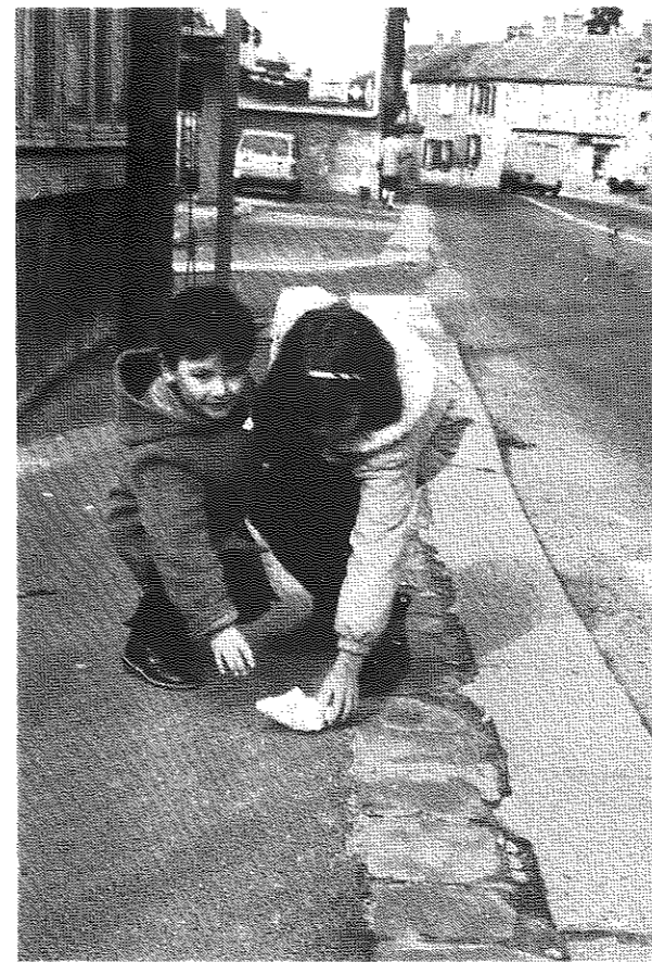
Valence plus propre