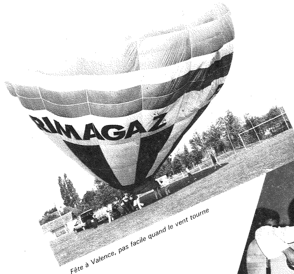
Fête à Valence, pas facile quand le vent tourne